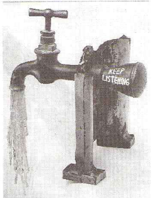
"הברז פתוח", 1992-93