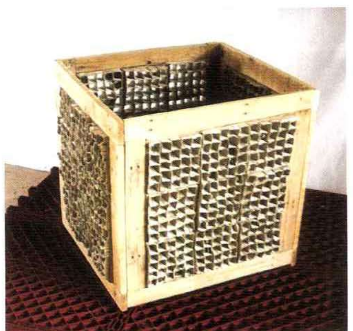
מחווה לאוה הסה - ישראלה הרגיל