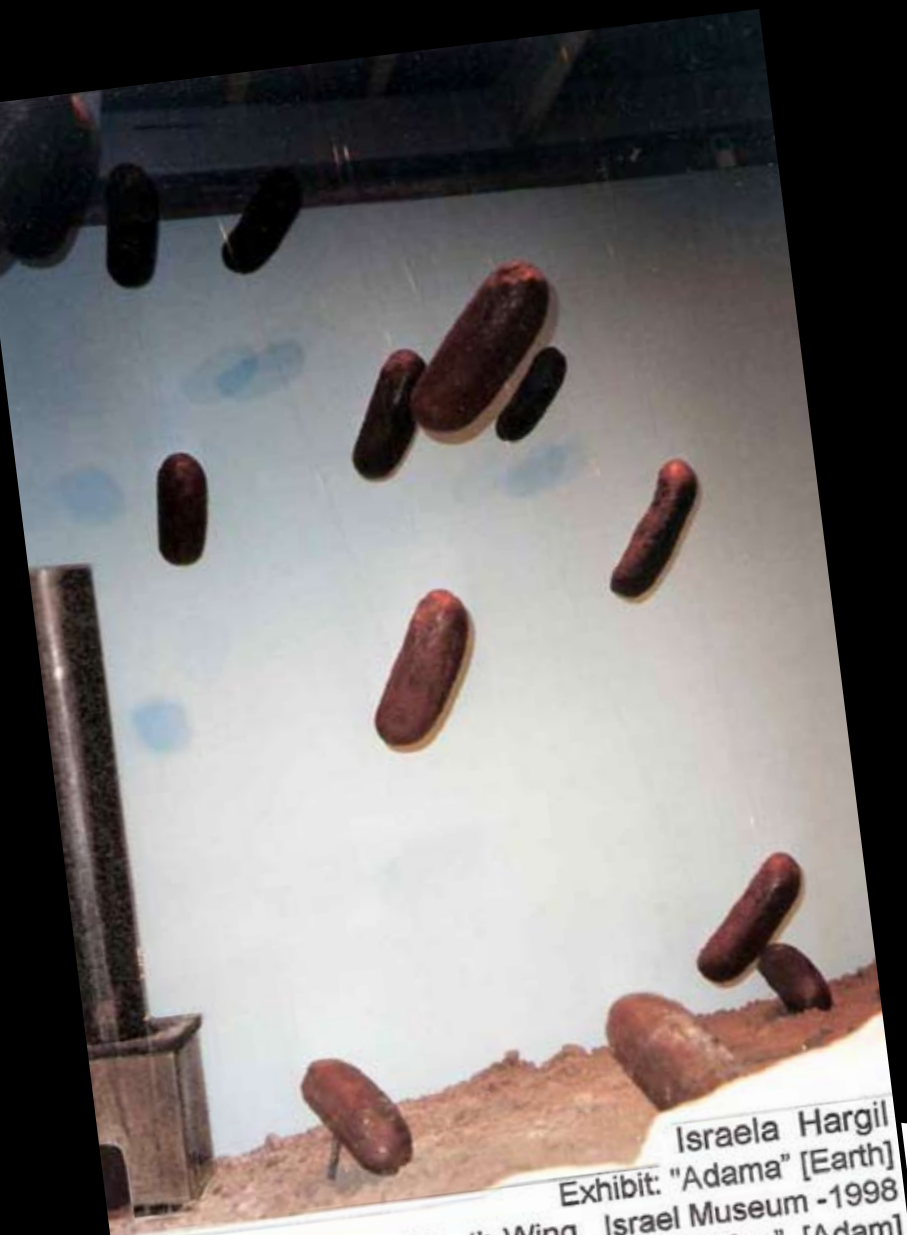
Israela Hargil Exhibit: "Adama" [Earth] Youth Wing, Israel Museum - 1998 Installation - 4x4x4m : " Bread for Every Man" [Adam]